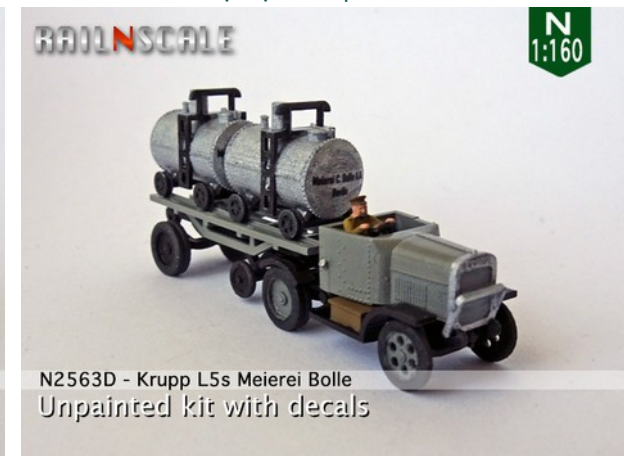
N2563D - Krupp L5s Meierei Bolle Unpainted kit with decals