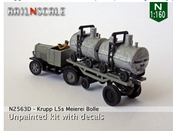
N2563D - Krupp L5s Meierei Bolle Unpainted kit with decals