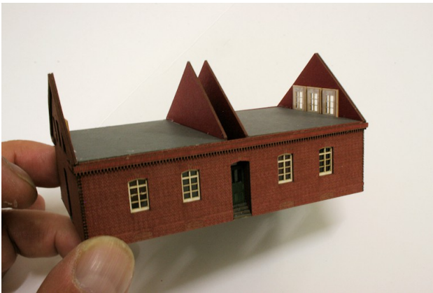
Bild 06: Nach Einbau aller Treppenteile, der Türen und der Zwischenwände in den vier Türbereichen sollte das Zwischenergebnis wie in diesem Bild aussehen (hier leider nicht ganz gerade !).

Bild 05: Ebenso werden die anderen Zwischenwände eingeklebt (Gravurseiten zur Türöffnung), die Türen werden von hinten vor die Stufen und an die Zwischenwände geklebt. Die kleinen Abdeckteile werden über die Tür geklebt.