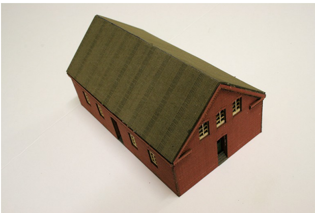
Bild 08: Aufkleben der Zierfrieße an den beiden Gebäudeseitenwänden.

Bild 07: Nun können die Zwischendecken (Aussparrung zeigt zu Fenstern der Seitenwände) und die Zierfrieße an Vorder- und Rückwand angebracht werden.